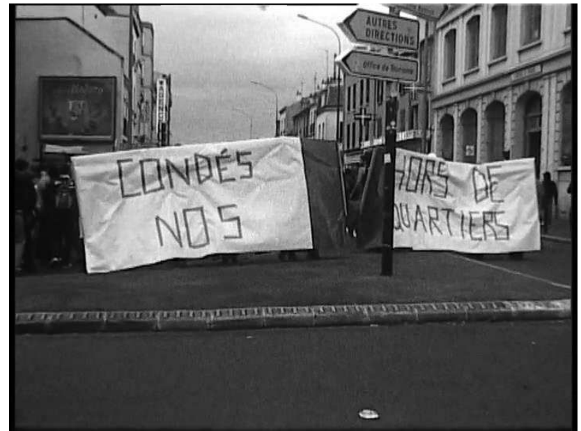
Striscioni rinforzati alla manifestazione dopo lo sgombero: "Sbirri fuori dai nostri quartieri", estratto dal video-volantino, collettivo 8 juillet.