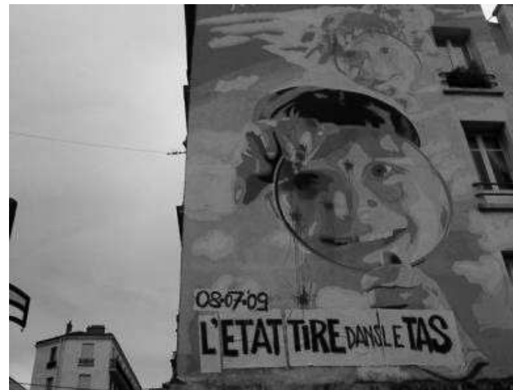
"Lo stato spara nel mucchio" azione su un murales in centro a Montreuil"

La guerra securitaria in corso è anche una guerra semantica, a partire dal lessico poliziesco. Come l'espressione "gestione democratica delle folle" (utilizzata per designare la repressione), il "Lanciatore di palle di Difesa (LBD)" è un capolavoro di creatività, a metà tra il linguaggio burocratico, l'operazione di marketing e la propaganda poliziesca. Si tratta, innanzitutto, di occultare che un fucile dotato di visore militare, conosciuto per sparare delle