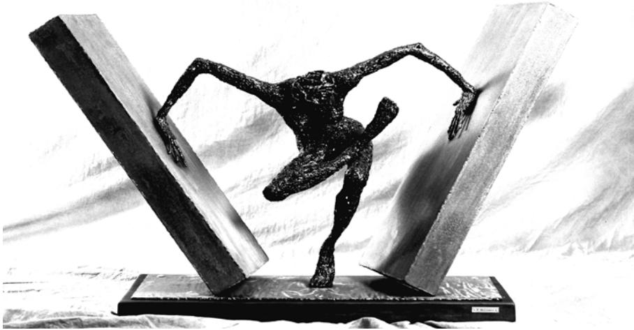
Oltre l'ostacolo , opera di Federico Molinaro.

Il diritto penale del nemico è in grado di collegare e unificare adeguatamente le diverse dimensioni dell'attacco ai movimenti sociali, quella giuridica come quella politica e mediatica: il progressivo ma costante aumento repressivo degli ultimi 15-20 anni è stato reso possibile grazie a un'incessante mobilitazione del circuito legislativo, giudiziario e istituzionale ma anche agli attacchi concertati tra media, stampa e magistratura.