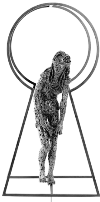
Senza titolo, opera di Federico Molinaro.

Il recente decreto Minniti, al di là delle misure specifiche che mette in campo, consegna una particolare agibilità a questo tipo di repressione. Quando parliamo di misure cautelari e di polizia, però, parliamo di provvedimenti introdotti da normativa precedente, di volta in volta emendata. Si può pertanto parlare di evoluzione in corso del sistema repressivo per cui la Minniti risulta solo l'ultimo tassello di un percorso omogeneo iniziato diversi anni fa.