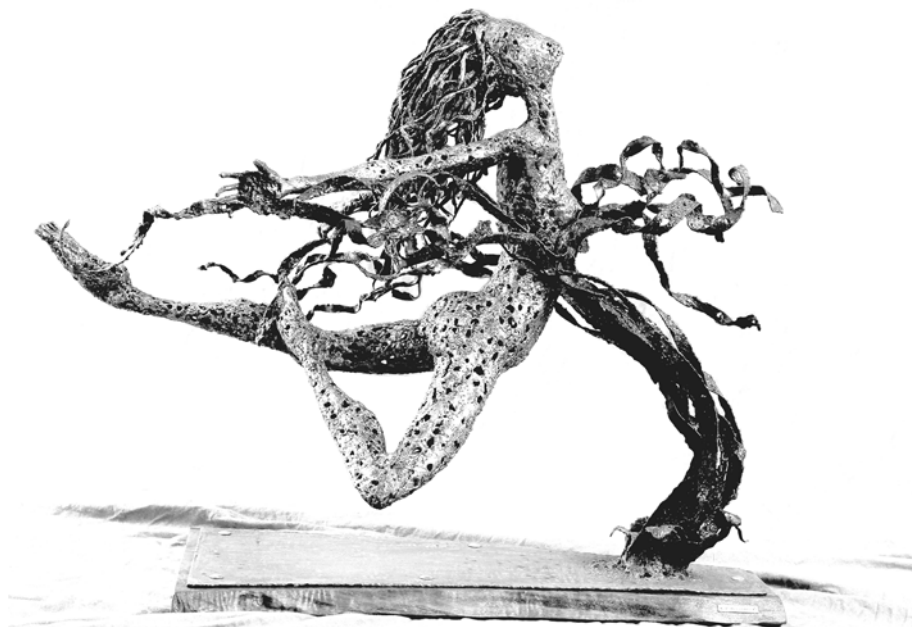
Contro corrente , opera di Federico Molinaro.

rivendicare pratiche di sabotaggio... Certamente senza lasciare nessuno indietro, ma anche con la volontà di allargare il fronte delle lotte, costruendo connessioni tra militanti, sfruttati e “banditi” dalle vecchie e nuove leggi nell’attuale fase dello scontro di classe. Una risposta alla repressione non può essere separata dalla continuazione e intensificazione delle lotte, non è un settore separato ma una parte integrante di esse.