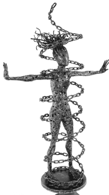
La mia catena , opera di Federico Molinaro.

Il proliferare delle forme preventive è senza dubbio un elemento centrale delle politiche repressive attuali. Tale tendenza caratterizza, a ben vedere, il sistema punitivo nel suo complesso e va oltre il campo di applicazione delle misure amministrative di polizia, che pure sono in aumento esponenziale. Lo scopo è quello di colpire il militante politico prima che riesca a manifestare una qualche potenzialità offensiva. L'utilizzo